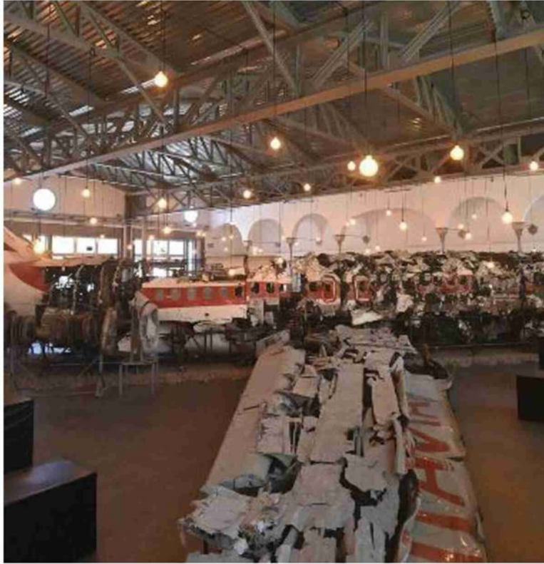
Il Museo per la memoria di Ustica, realizzato da Boltanski con i resti dell'aereo